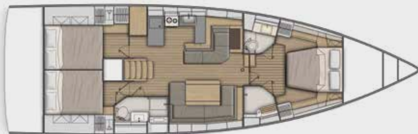
LOWER DECK 3 cabins, 2 bathrooms version - Version 3 cabines, 2 salles d'eau