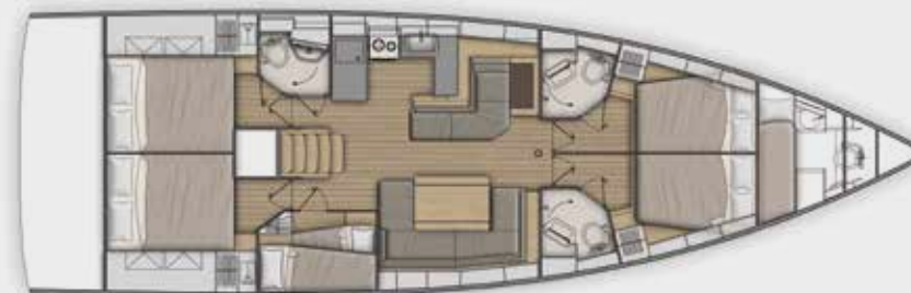
LOWER DECK 5 cabins, 3 bathrooms version - Version 5 cabines, 3 salles d'eau