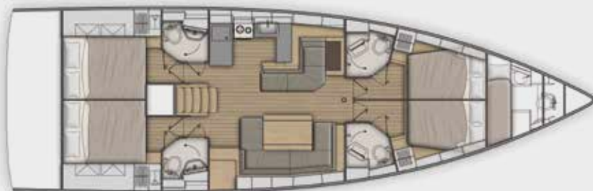
LOWER DECK 4 cabins, 4 bathrooms version - Version 4 cabines, 4 salles d'eau