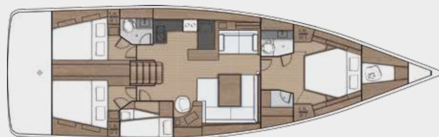
LOWER DECK 4 cabins, 2 bathrooms version - Version 4 cabines, 2 salles d'eau