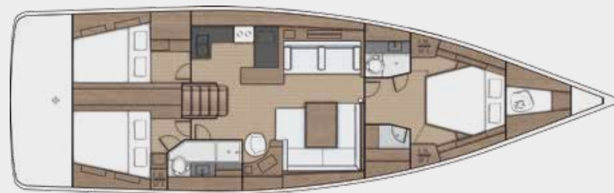
LOWER DECK 3 cabins, 2 bathrooms version - Version 3 cabines, 2 salles d'eau