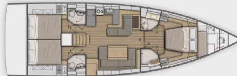
LOWER DECK 3 cabins, 3 bathrooms version - Version 3 cabines, 3 salles d'eau