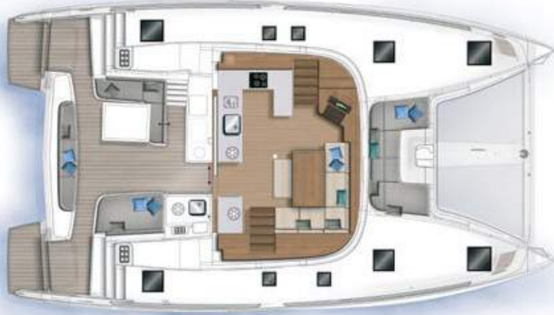
Carré et cockpit / Saloon and cockpit