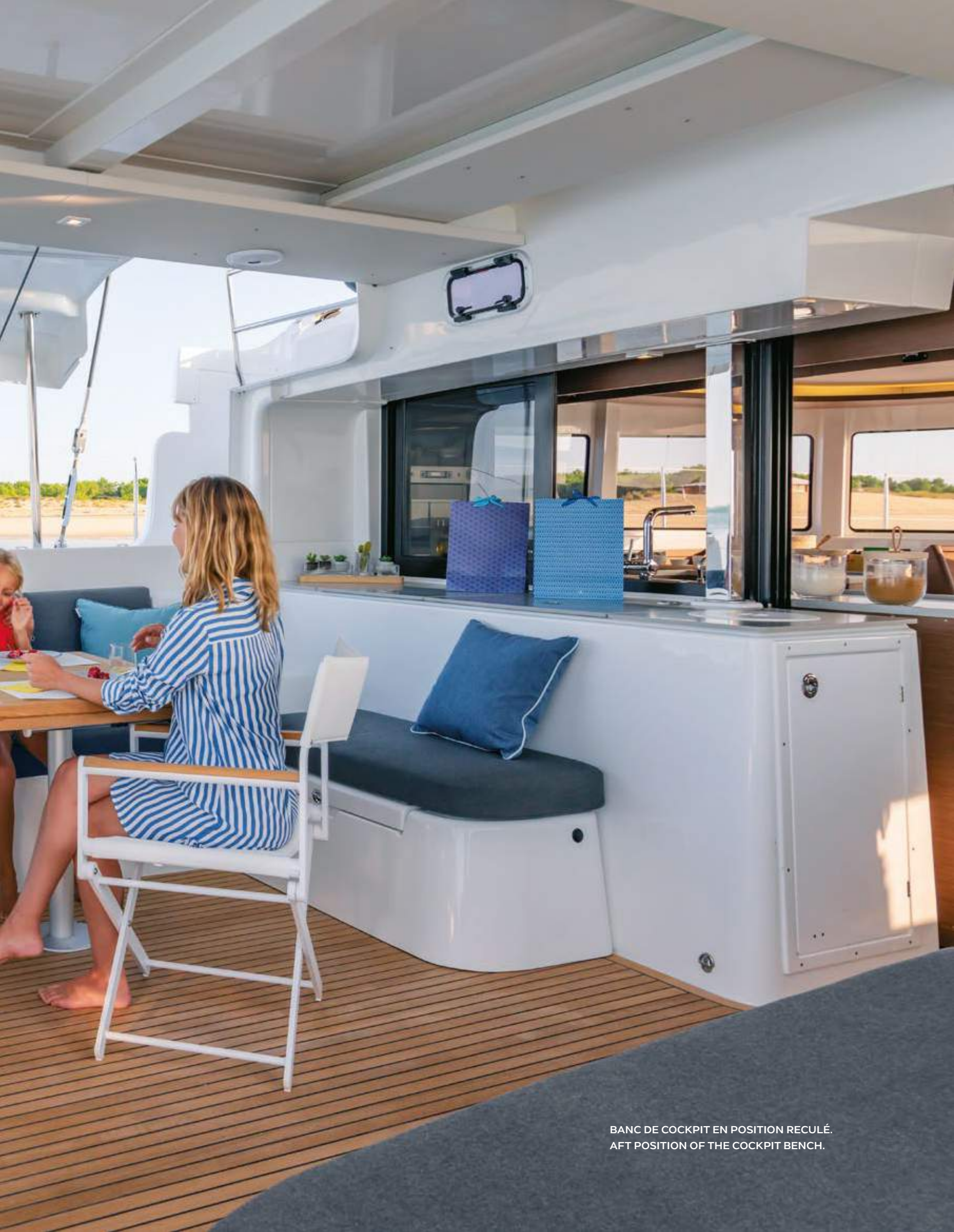
BANC DE COCKPIT EN POSITION REULÉ. AFT POSITION OF THE COCKPIT BENCH.