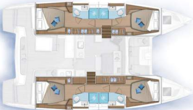
4 cabines, 4 salles d'eau / 4 cabins, 4 bathrooms