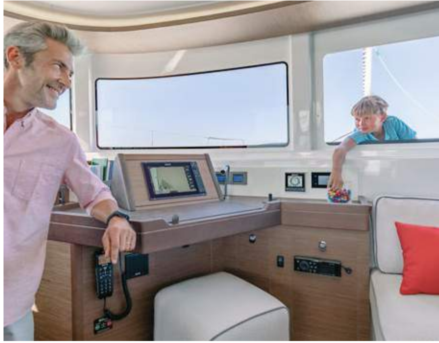
VITRAGE COULISSANT OUVERT. SLIDING SASH WINDOW OPENED.