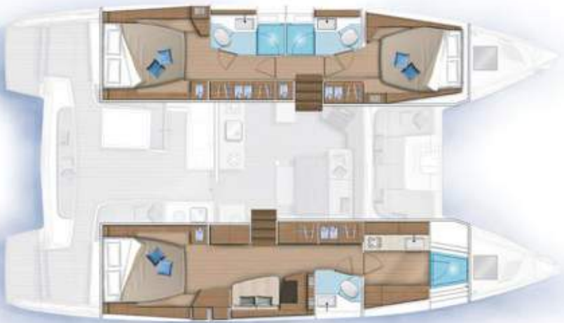
3 cabines, 3 salles d'eau / 3 cabins, 3 bathrooms